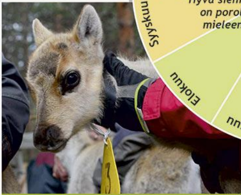
Vasaleikko - vasojen merkintä