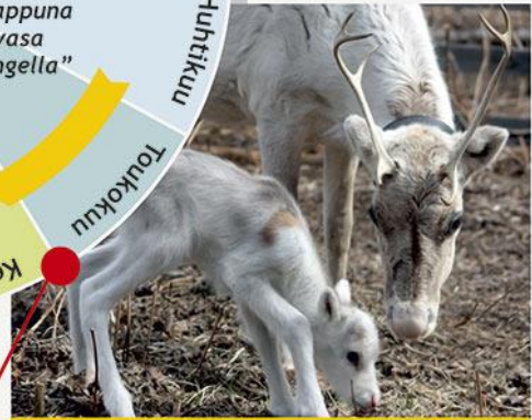
Vasonta - vasojen syntyminen

Poronhoitovuosi vaihtuu touko- ja kesäkuun vaihteessa